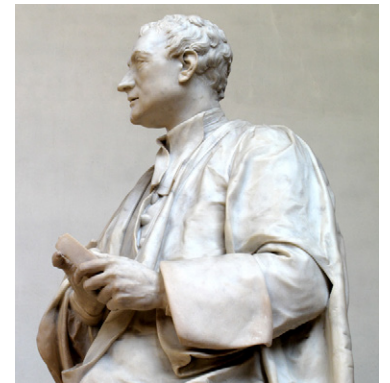
Isaac Newton (1643 – 1727), statuie de Louis Francois Roubiliac (1755), Trinity College Chapel (Cambridge)

14 Pe care dintre cărțile descoperite citind textul Roxanei Jidveian nu ai citit-o și ai vrea să o citești? Explică de ce.